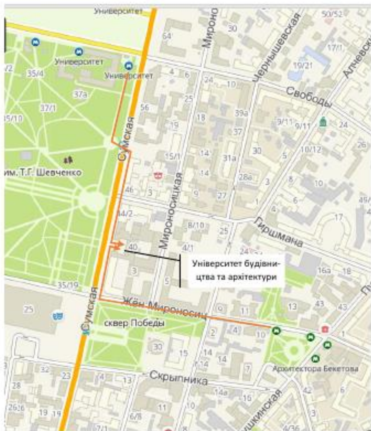
Місцезнаходження Харківського національного університету будівництва та архітектури